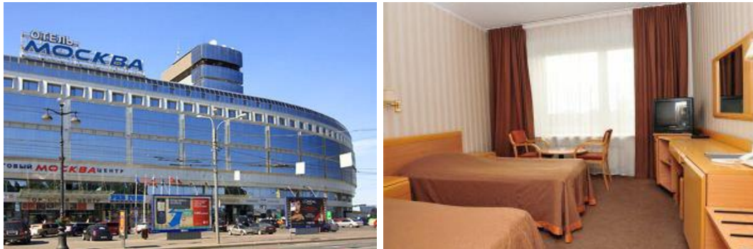
Alexander Newskij Ploschad 2, St. Petersburg, 193317 Russland

Das Drei-Sterne Hotel wurde 1976 erbaut und gehört zu den Touristenhotels mit typischen sowjetischen Aussehen. Das Gebäude ist größtenteils renoviert. Mit 770 Zimmern ist es das drittgrößte Hotel in Sankt-Petersburg und wird meist von großen Reisegruppen sowie Pauschaltouristen benutzt. Beliebt ist es wegen seiner Lage. Es befindet sich gleich am Newskij Prospekt gegenüber dem Alexander- Newskij-Kloster und in der Nähe des Moskauer Bahnhofs. Eine Metrostation ist in hotelnähe. Das Restaurant bietet europäische und russische Küche, es gibt eine Bar mit Konzertprogramm, Café und Büfets auf jeder Etage und 2 Bankett-Räume.